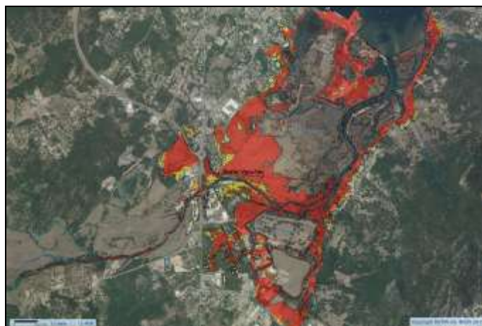
Partie Nord de l'embouchure du Stabiacciu