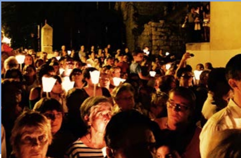
Procession au départ de l'église St Jean Baptiste à 22h vers le port de plaisance.