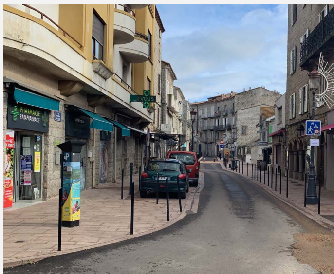
Photographie du centre-ville 2018, sans les porto-vecchiaïsi