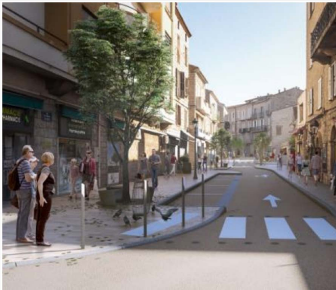
Montage du projet centre-ville 2016 présenté aux porto-vecchiaïsi